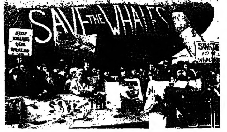
سلامة الحيتان البريطانية !